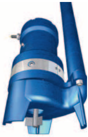
Szállítható verzió keverővel