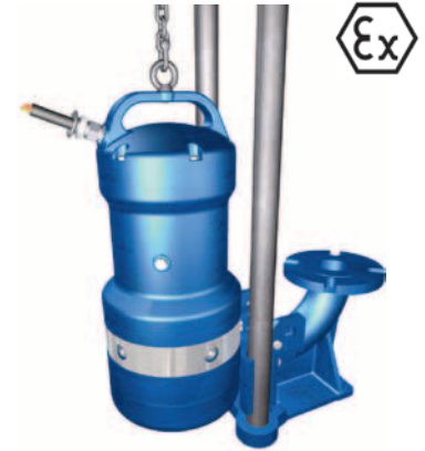
Lúdtalp alakú csatlakozóval történő szerelés

A Wemco szivattyúk képesek nagy méretű abrazív vagy korrózív részecskéket továbbítani a legszigorúbb követelményeket támasztó alkalmazásoknál is, minimálisra csökkentve a kopás és dugulás kockázatát.