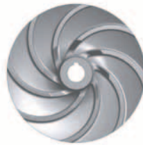
Járókerék ívelt lapátozással