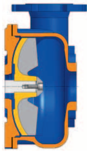
Íves járókerék profil