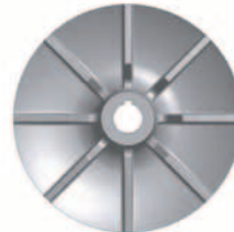
Járókerék sugár irányú lapátozással