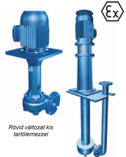
Rövid változat kis tartólemezzel